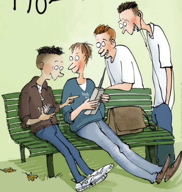
Freude an der Langlebigkeit