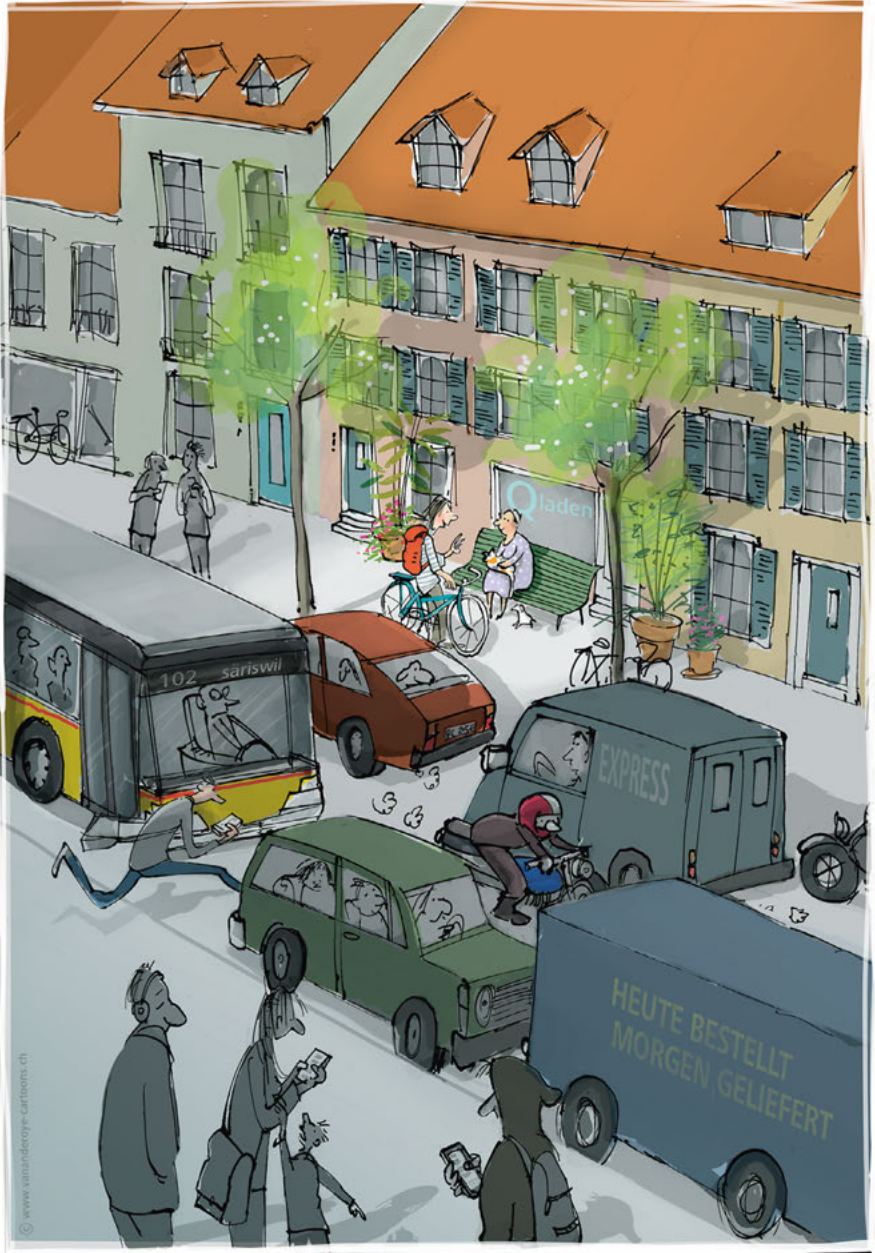
Auf der Suche nach dem angemessenen Tempo