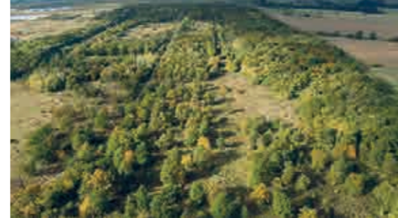
Der erste Wildkatzenkorridor verbindet seit 2007 den Nationalpark Hainich mit dem Thüringer Wald.

In dieser Zeit setzte ein Wandel ein, mit dem Wildkatzenwegeplan als wichtigem Baustein. Das Bundesamt für Naturschutz wurde mit dem Bundesprogramm Biologische Vielfalt zum derzeit wichtigsten Unterstützer eines bundesweiten Biotopverbunds und fördert das aktuelle BUND-Projekt „Wildkatzensprung“ mit Mitteln des Bundesumweltministeriums. Und auch beim BUND selbst brachten die Ergebnisse des Wildkatzenwegeplans einiges ins Rollen: Aus verschiedenen regionalen Initiativen für die Wildkatze ist das größte Projekt in der Geschichte des BUND geworden. In sechs BUND-Landesverbänden, in Hessen, Rheinland-Pfalz,